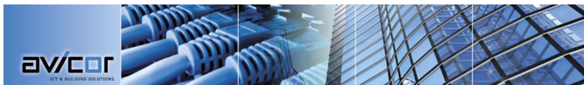
Umfassende Dienstleistungen aus einer Hand.

Avicor Services AG Sihlbruggstrasse 105a, 6340 Baar Tel 041 766 44 44, Fax 041 766 44 49 welcome@avicor.ch www.avicor.ch