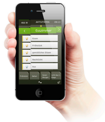
digitalSTROM - Intelligente Haussteuerung.

avicor bietet wirtschaftliche Lösungen mit Renovation Smart Home System, KNX und digitalSTROM für Neu- oder Umbauten. Dies kompetent und für jedes Budget. Es werden bevorzugt offene Systemlösungen eingesetzt, damit von der Vielfalt verschiedenster Produkthanbieter profitiert werden kann.